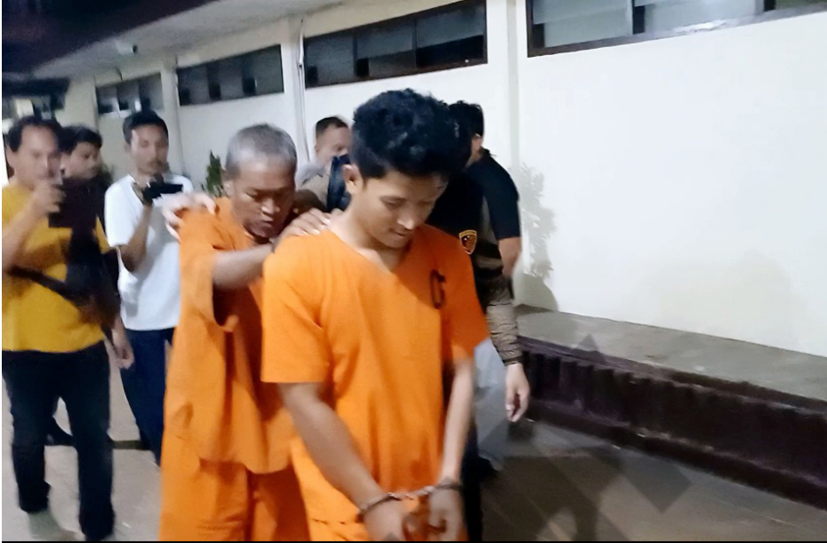
Gambar 4. Kasus Pencabulan Anak Padangsidimpuan