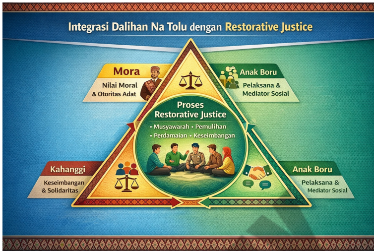
Gambar 2. Integrasi Dalihan Na Tolu dengan Restorative Justice

Dalihan Na Tolu menempatkan relasi antarindividu sebagai inti kehidupan sosial. Hula-hula, dongan tubu, dan boru tidak hanya memiliki fungsi seremonial, tetapi juga berperan aktif dalam menjaga stabilitas sosial. Ketika muncul perselisihan, unsur-unsur tersebut terlibat dalam proses musyawarah untuk mencari jalan keluar yang dapat diterima bersama. Mekanisme ini menunjukkan bahwa penyelesaian konflik diarahkan pada pemulihan relasi, bukan pada pembalasan.