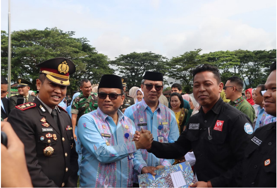
Gambar 8. AKBP Dr. Wira Prayatna, S.H., S.I.K., M.H., Kapolres Padangsidimpuan, pada kegiatan peresmian Panti Rehabilitasi Narkoba Kota Padangsidimpuan, 17 Oktober 2025.

pemulihan bagi penyalahguna narkoba, sementara fasilitas rehabilitasi yang tersedia di wilayah Tapanuli Selatan masih sangat terbatas. Sebelumnya, pengguna narkoba yang membutuhkan rehabilitasi harus dirujuk ke luar daerah, yang berdampak pada keterlambatan penanganan dan meningkatnya beban biaya serta sosial bagi keluarga.