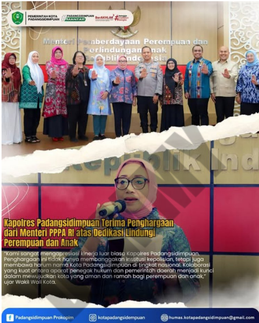
Gambar 6. Kapolres Padangsidimpuan Terima Penghargaan dari Menteri PPPA