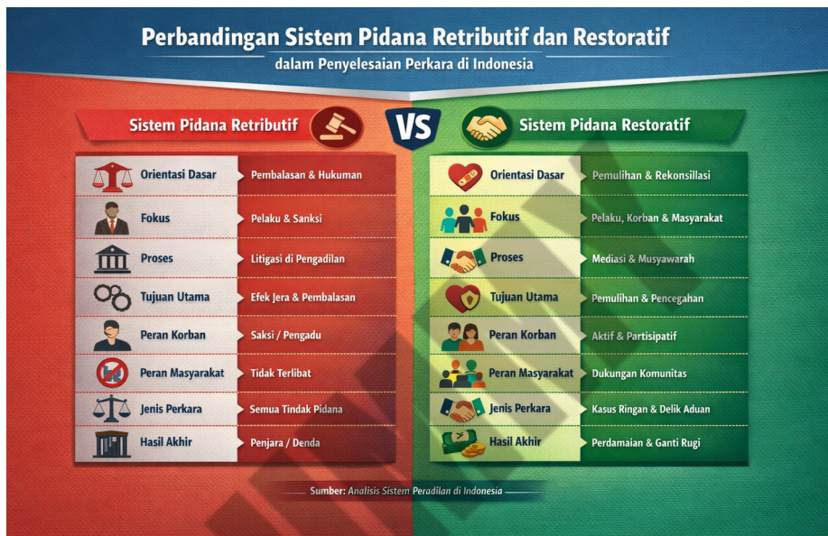
Gambar 1. Perbandingan Sistem Pidana Retributif dan Restoratif

internasional, menunjukkan bahwa program Restorative Justice dalam banyak kasus meningkatkan kepuasan korban dan menurunkan tingkat residivisme. Temuan ini kemudian diperkuat oleh meta-analisis Latimer dalam The Prison Journal , yang menyimpulkan bahwa program Restorative Justice secara signifikan meningkatkan kepuasan korban dan akuntabilitas pelaku dibandingkan proses peradilan konvensional.