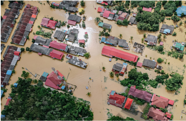
Gambar 9. Dampak Banjir sebagai Ancaman Bagi Masyarakat